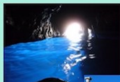
カプリ島 青の洞窟

ソレント半島南部、地中海に面しており、世界一美しい海岸と言われています。かつてはベネチアと肩を並べるほどの海運で発展した都市で、素晴らしい遺産の数々、そこまで透き通るような美しい海、断崖の海岸線、カラフルな家並みなどを心から満喫することができます。人々は斜面に家々を建て、聖堂や修道院を建造し、さらに年間を通じての温暖な気候を利用してアーモンドやブドウ、さまざまな花々などを栽培しています。映画アマルフィの舞台ともなりました。