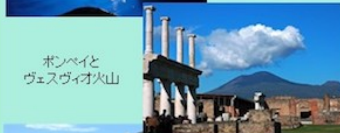
ポンベイと ヴェスヴィオ火山